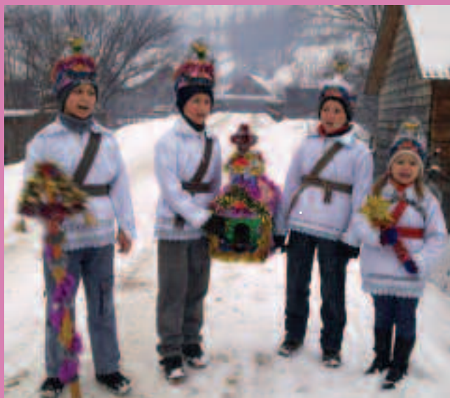
Колядники із с. Поляни