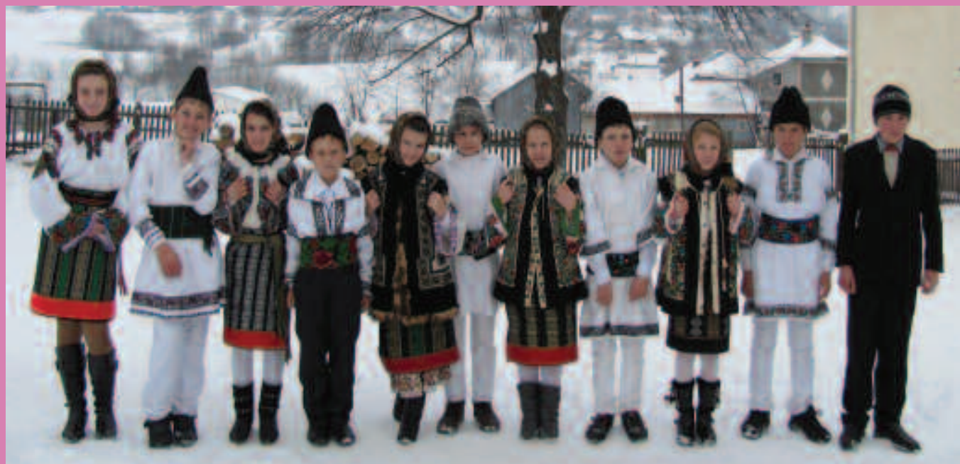
Вокальний гурт «Червона калина» зі школи Келінешть Купаренко Сучавського повіту